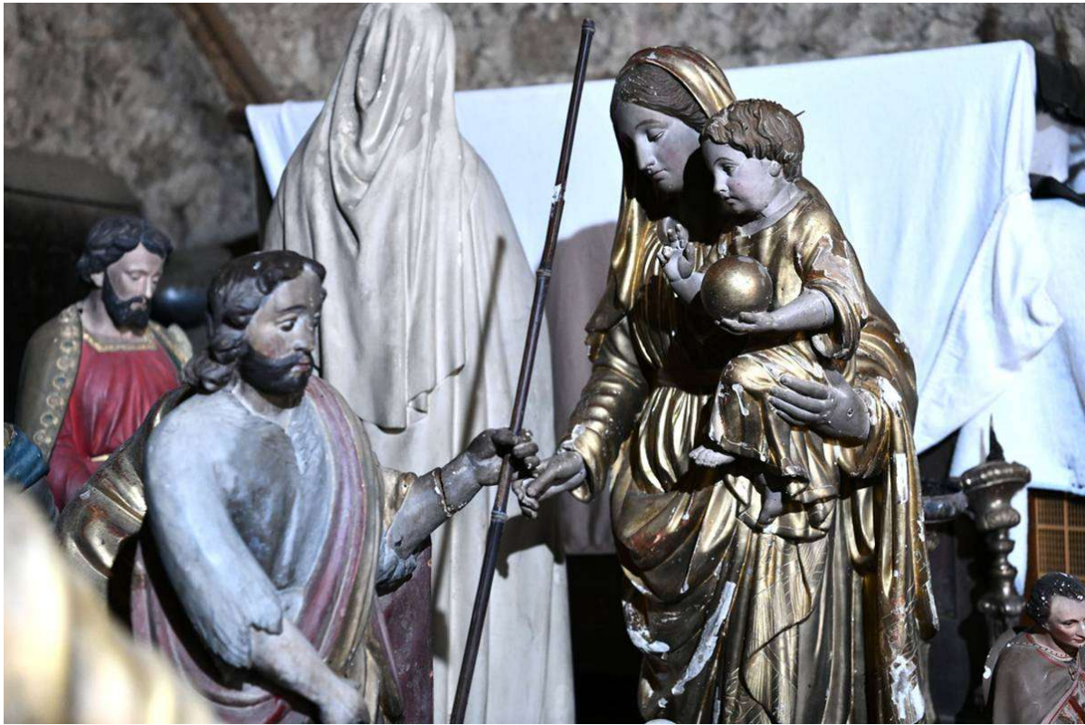
Une vierge à l'enfant sauvée des flammes. le 20/01/2021, Photo Stéphanie Para.

Au final, des chandeliers, la crèche, une dizaine de statues religieuses et les tableaux du chemin de croix ont pu être évacués du sinistre, et rassemblés dans un endroit sûr. Le tabernacle de l'autel, en partie calciné, a lui aussi été sorti de l'église.