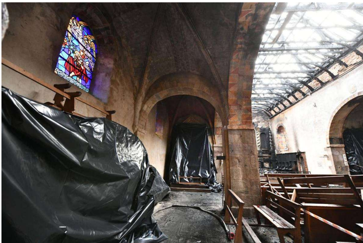
L'église de Voutezac le 20 janvier 2021, photo Stéphanie Para.

D'une part, parce qu'il est possible que la commune ait, au final, besoin de plus que de 60.000 euros pour réhabiliter l'édifice. "Cet objectif [...] nous a semblé raisonnable et cohérent [...]. Il reste cependant ajustable étant donné que le montant des travaux comme le montant des subventions qui seront allouées à cette restauration sont toujours inconnus", explique la Fondation du patrimoine dans un communiqué ce vendredi 29 janvier.